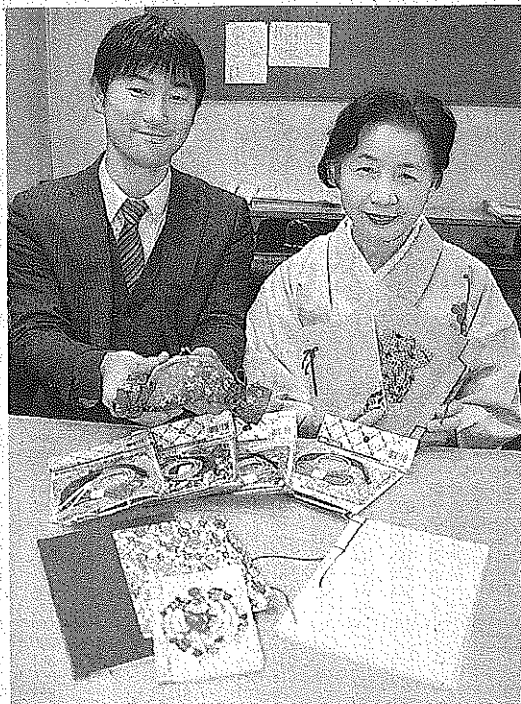
ワックジャパンと植村が共同開発した針を使わない和綴じ本とがま口。外国人向けの文化体験サービスに活用する(京都市中京区)

京都商工会議所から知恵ビジネスプランの認定を受けた京都企業3社が連携し、外国人観光客向けの文化体験キットと修学旅行生向けの農業体験ツアーを開発した。京商が推進する「知恵の森」が広がりを見せている。着付けや書道などの文 京文化の魅力を発信す (上京区)と共同開発した。穴が開いた和紙にひく。ワックジャパン(京都 文化体験キットは、外もを通して製本する和と市中京区)が中心となっ 国人が針を使わずに手芸 じ本と、生地を縫わずに て取り組んだ。京都の知 を楽しめる手芸用品で、 ひもでくるがまぐちの 恵を生かして観光客らに 手芸材料メーカーの植村 2種類。ワックジャパン